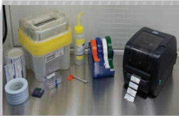
无尘室胶带和标签