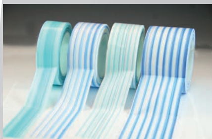
施工 Protocol™ 胶带